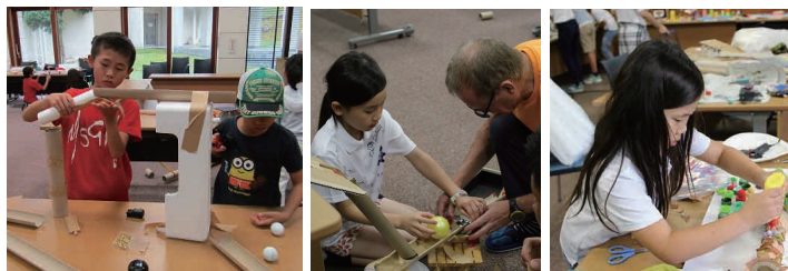
様々なアクティビティを通して、『英語で考える&英語を使う』体験型学習を実施しています